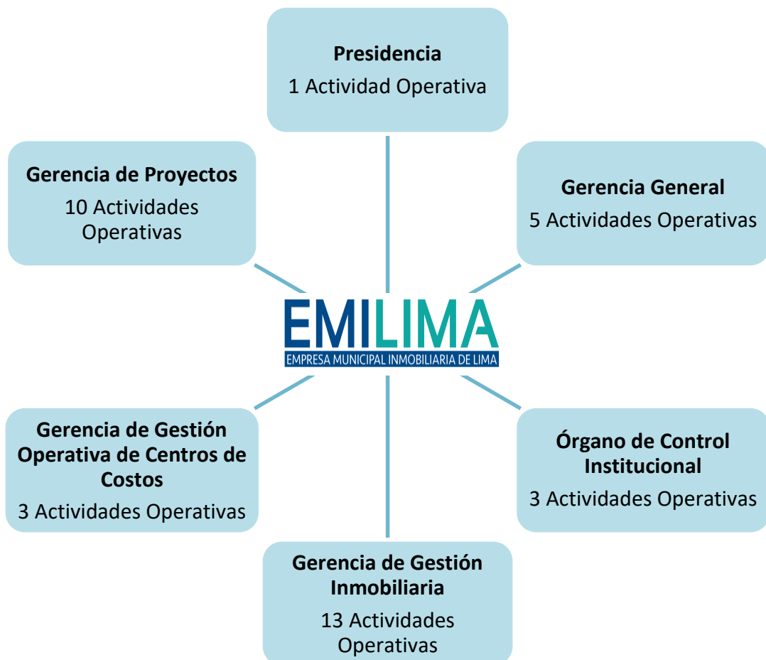
Gráfico N° 01: Distribución de Actividades Operativas (AO) de la Presidencia, Gerencia General, Órgano de Control y Órganos de Línea de EMILIMA S.A.

A continuación, se muestra el detalle de este despliegue: