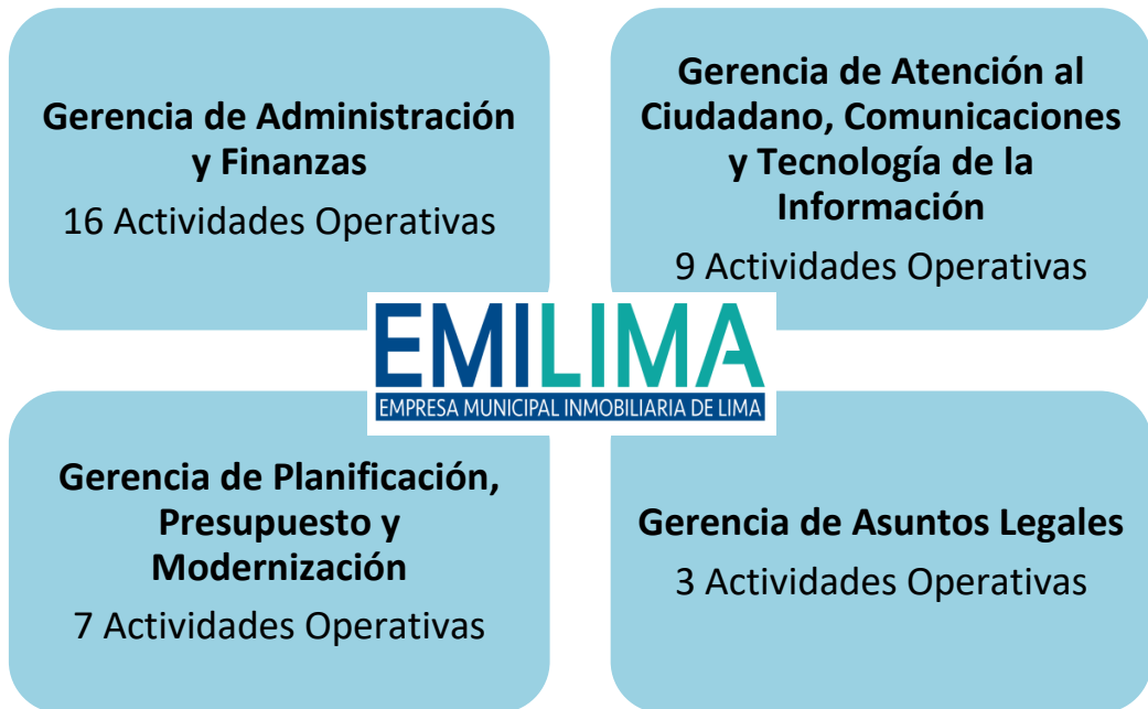
Gráfico N° 02: Distribución de Actividades Operativas (AO) de los Órganos de Apoyo y de Asesoramiento de EMILIMA S.A.