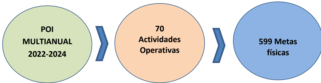
Gráfico N° 03: Resumen de actividades operativas y metas físicas del POI Multianual 2022-2024