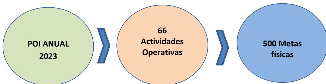
Gráfico N° 03: Resumen de actividades operativas y metas físicas del POI Anual 2023