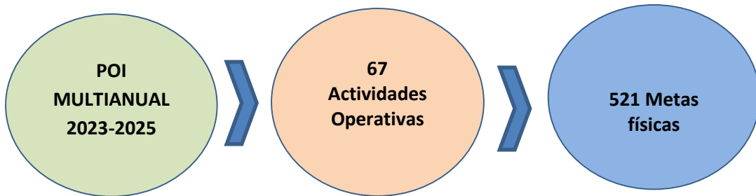
Gráfico N° 03: Resumen de actividades operativas y metas físicas del POI Multianual 2023-2025