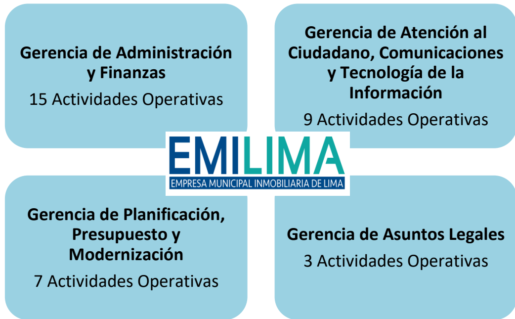
Gráfico N° 02: Distribución de Actividades Operativas (AO) de los Órganos de Apoyo y de Asesoramiento de EMILIMA S.A.