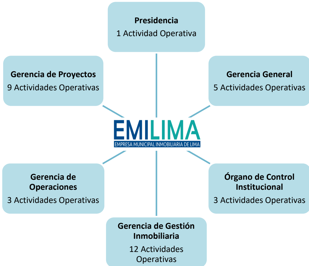
Gráfico N° 01: Distribución de Actividades Operativas (AO) de la Presidencia, Gerencia General, Órgano de Control y Órganos de Línea de EMILIMA S.A.