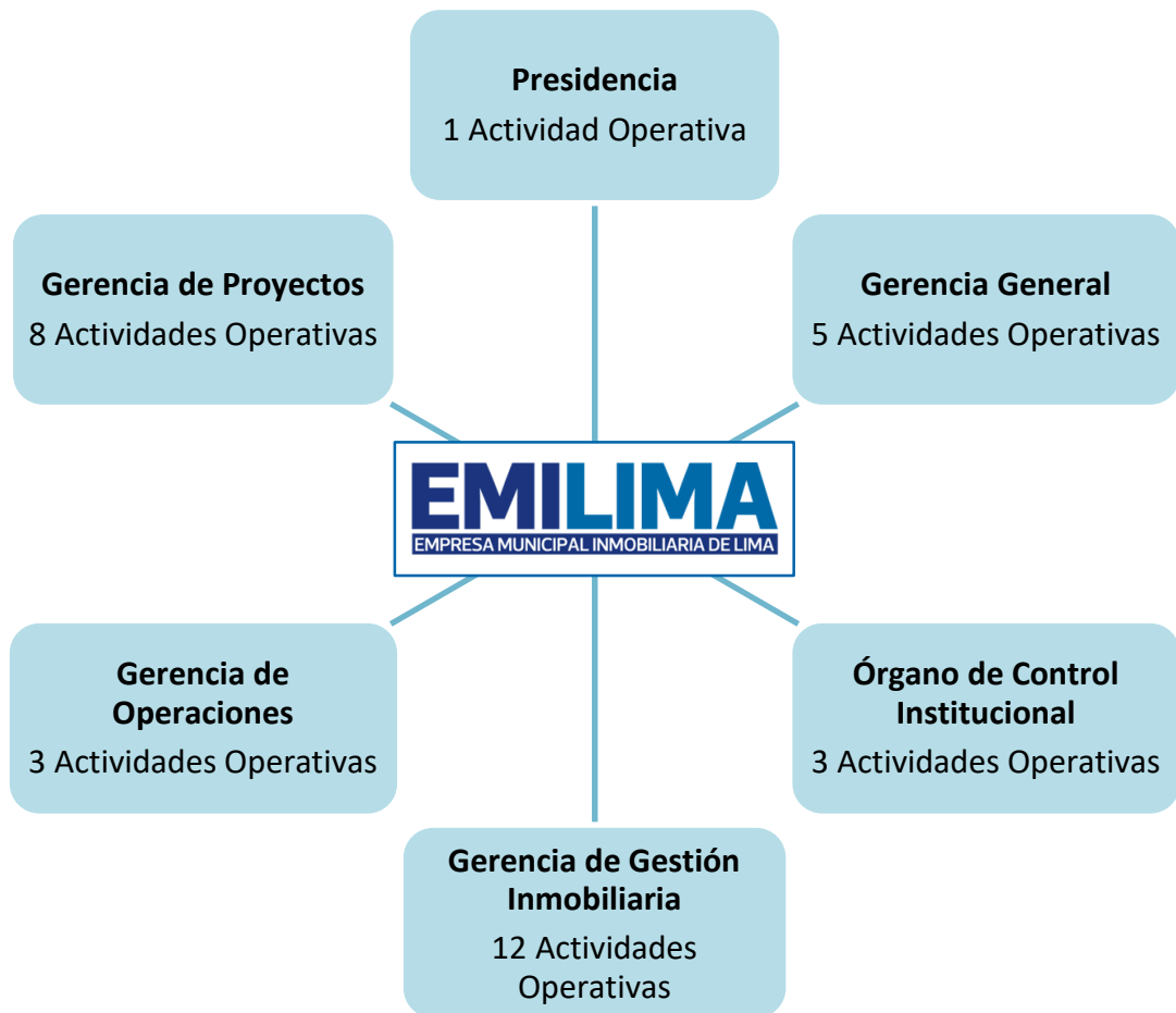
Gráfico N° 01: Distribución de Actividades Operativas (AO) de la Presidencia, Gerencia General, Órgano de Control y Órganos de Línea de EMILIMA S.A.