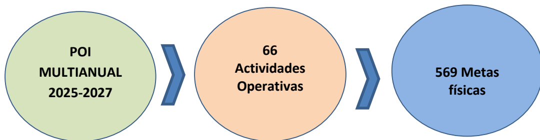
Gráfico N° 03: Resumen de actividades operativas y metas físicas del POI Multianual 2025-2027