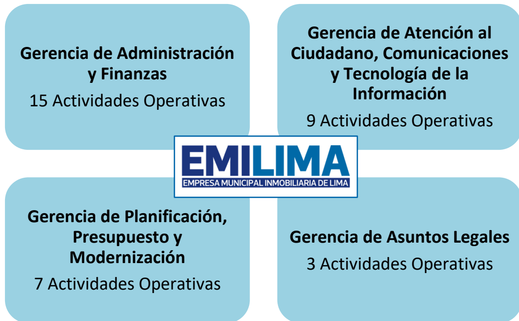
Gráfico N° 02: Distribución de Actividades Operativas (AO) de los Órganos de Apoyo y de Asesoramiento de EMILIMA S.A.